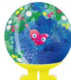
公式マスコットキャラクター 「トウクントウク」